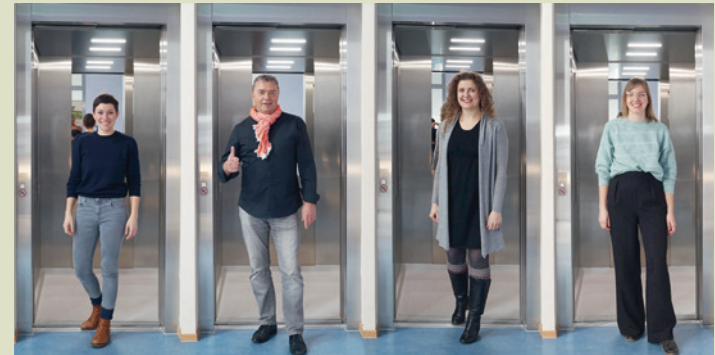
Abteilung für Presse- und Öffentlichkeitsarbeit der Freunde

Tel: +49 (0)721 20111-140 presse@freunde-waldorf.de